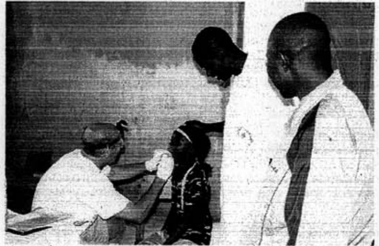
Le Sénégal a permis au dentiste de parfaire son organisation. ©

"Une deuxième mission est d'ores et déjà prévue"